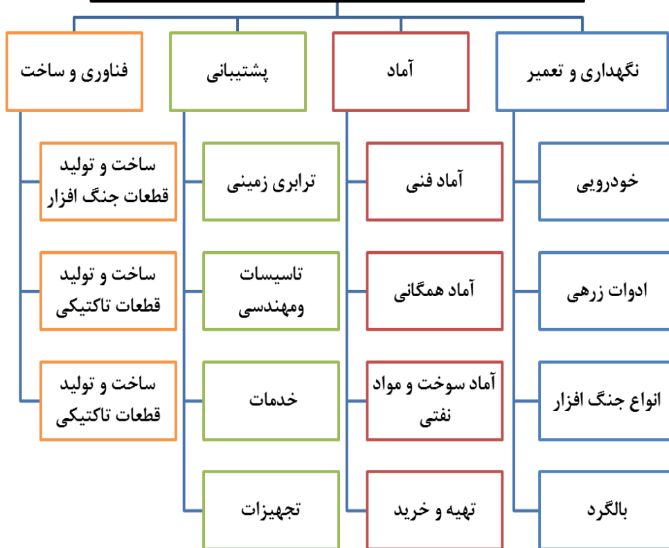
نمودار شماره (۱) ابعاد و مؤلفه های سامانه اطلاعات مدیریت